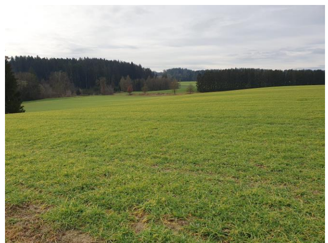
Abb. 4: Gehölzstruktur im Osten