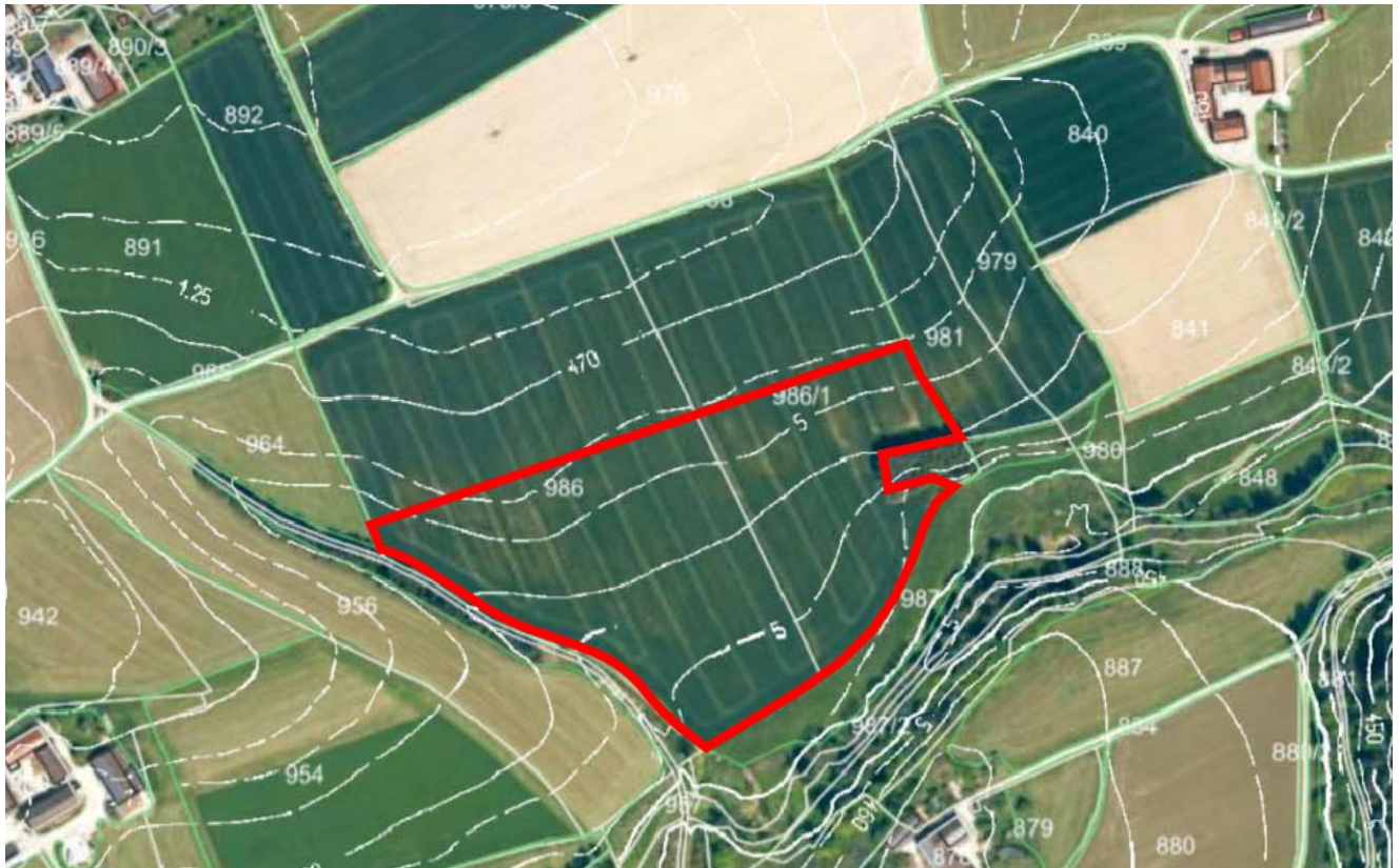
Abb. 2: Darstellung des Bestands im Luftbild

Das Plangebiet besteht aus einer landwirtschaftlich genutzten Ackerfläche und geht nach allen Seiten in die freie Kulturlandschaft über. Im Osten befindet sich ein Feldweg. Im Süden befindet sich in einiger Entfernung der Kolbinger Bach. Im Norden schließt sich ebenfalls landwirtschaftlich genutzte Fläche an. Das Plangebiet wird im Osten von einem kleinen Waldgebiet berührt.