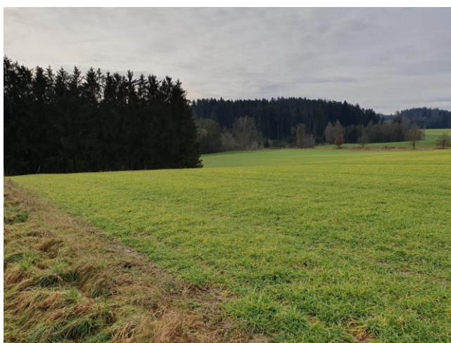
Abb. 3: Plangebiet

Das Plangebiet besteht aus einer landwirtschaftlich genutzten Ackerfläche und geht nach allen Seiten in die freie Kulturlandschaft über. Im Osten befindet sich ein Feldweg. Im Süden befindet sich in einiger Entfernung der Kolbinger Bach. Im Norden schließt sich ebenfalls landwirtschaftlich genutzte Fläche an. Das Plangebiet wird im Osten von einem kleinen Waldgebiet berührt.