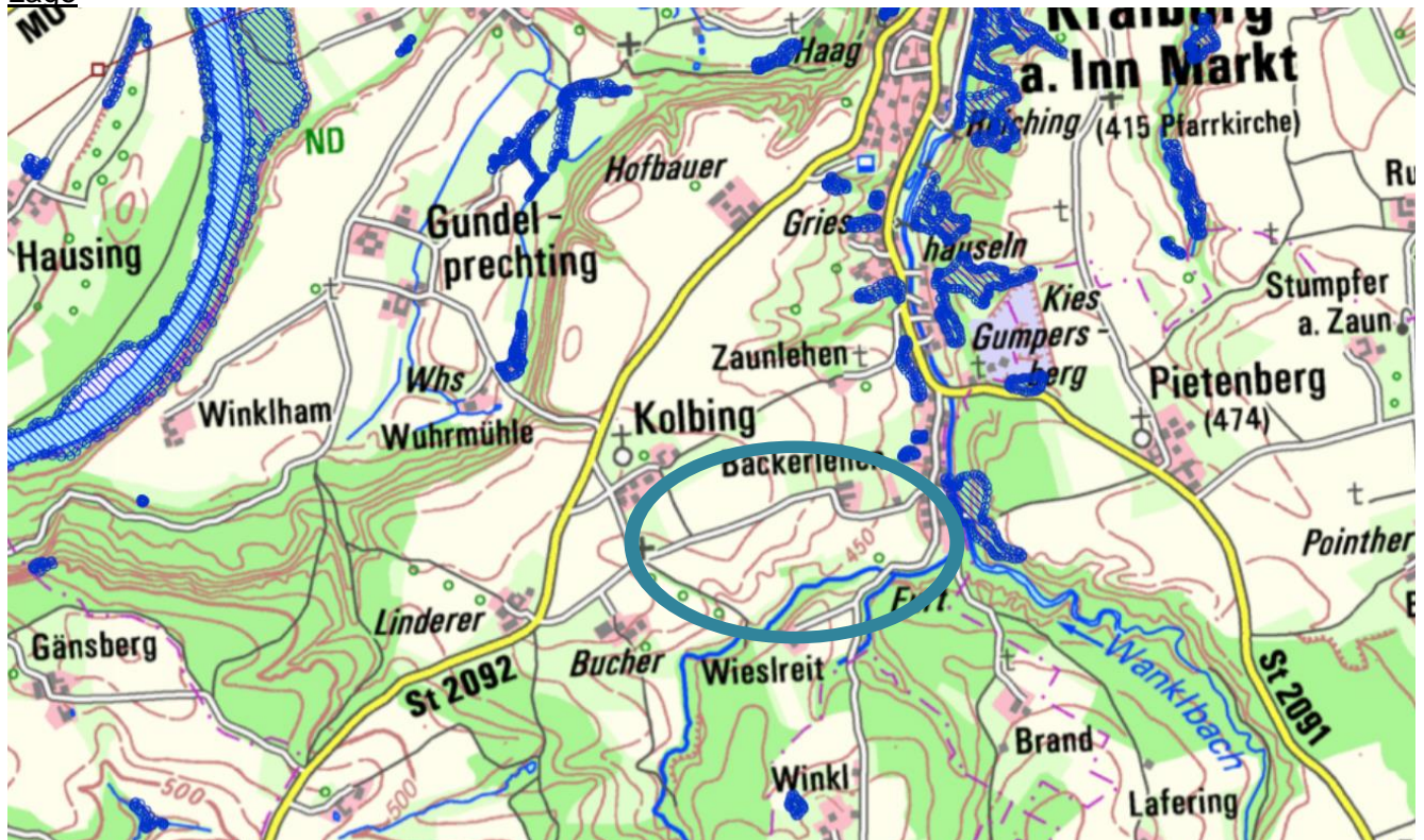
Abb. 1: Lage des Gebiets

Das Planungsgebiet liegt südlich von Kraiburg zwischen Kolbing und Wiesleit. Das Gebiet ist über die Staatsstraße St 2092 und die Gemeindeverbindungsstraße nach Kolbing erschlossen.